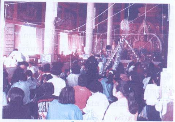
พิธีสับชะตาให้กับผู้ติดเชื้อเด็กกำพร้า และผู้ได้รับผลกระทบ