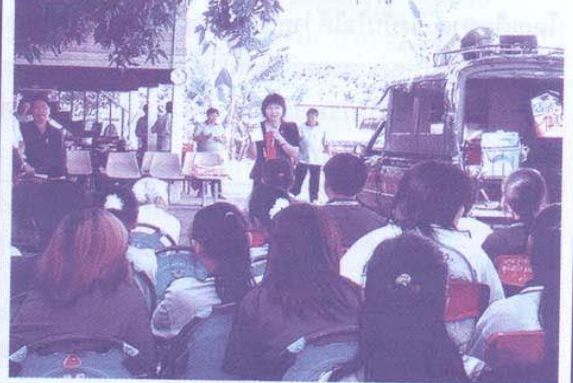
ประชาสัมพันธ์โครงการ ขาด้านไวรัสในกลุ่มเลือดต่าง