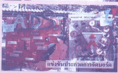
แข่งขันประกวดการจัดบอร์ด