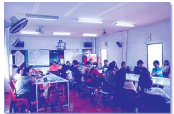
“การอบรมการใช้คู่มือระบบดูแลช่วยเหลือนักเรียนในโครงการฮักชุมชนอำเภอสันกำแพง”

ปิดท้ายด้วยโครงการฮักชุมชนอำเภอสันกำแพงที่ตอนนี้องค์กรโรงเรียนต่างๆ ในอำเภอสันกำแพงได้นำคู่มือระบบดูแลช่วยเหลือนักเรียนของโครงการฮักชุมชนเข้าไปใช้ในโรงเรียนแล้ว ได้แก่ โรงเรียนบ้านหนองโค้ง โรงเรียนบ้านแม่ปุคา โรงเรียนบ้านบวค่าง โรงเรียนวัดล้านตอง โรงเรียนสันกำแพง และโรงเรียนบ้านสันกำแพง สำหรับคู่มือทักษะชีวิตของโครงการฮักชุมชนนั้น ตอนนี้อยู่ในขั้นตอนของการจัดทำซึ่งก็คาดว่าจะสามารถนำไปใช้ได้ในวัน และผลจากการดำเนินงานร่วมกันของภาคส่วนต่างๆ ในอำเภอสันกำแพงที่ผ่านมาโดยเฉพาะในภาคส่วนการศึกษานั้นทำให้เกิดแนวคิดในการจัดตั้งชมรมเครือข่ายครูของโครงการฮักชุมชนอำเภอสันกำแพงขึ้นมาเพื่อเป็นการช่วยเหลือการทำงานให้เกิดการประสานงานกันเป็นภาคีเครือข่ายมากขึ้น และเสริมสร้างกระบวนการการทำงานให้มีประสิทธิภาพที่ดีขึ้น นอกจากนี้แล้วโครงการฮักชุมชนอำเภอสันกำแพงยังมีแผนในการดำเนินกิจกรรมต่างๆ อีกหลากหลายกิจกรรมในปีที่จะถึงนี้เพื่อช่วยลดการใช้สารเสพติดและพฤติกรรมเสี่ยงทางเพศสัมพันธ์ในกลุ่มเด็กและเยาวชน อาทิเช่น การมีส่วนร่วมของชุมชนในการดูแลช่วยเหลือฟื้นฟูผู้ป่วยจากสารเสพติด การมีส่วนร่วมของชุมชนในการเฝ้าระวังและดูแลลูกหลานในชุมชนให้ห่างไกลจากยาเสพติด โครงการงดเหล้าในงานบุญประเพณี รวมถึงการสร้างกระบวนการมีส่วนร่วมของเด็กและเยาวชนในกิจกรรมต่างๆ เป็นต้น