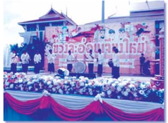
“งานช่วงละอ่อนเจียงใหม่ ครั้งที่ 9 ซึ่งจัดโดยเครือข่ายเด็กและเยาวชนอำเภอสันทราย”

สาธารณะกับกระทรวงพัฒนาสังคมและความมั่นคงของมนุษย์ ทั้งนี้เพื่อยกระดับความร่วมมือและเสริมสร้างประสิทธิภาพการทำงาน ของเครือข่ายนั่นเอง