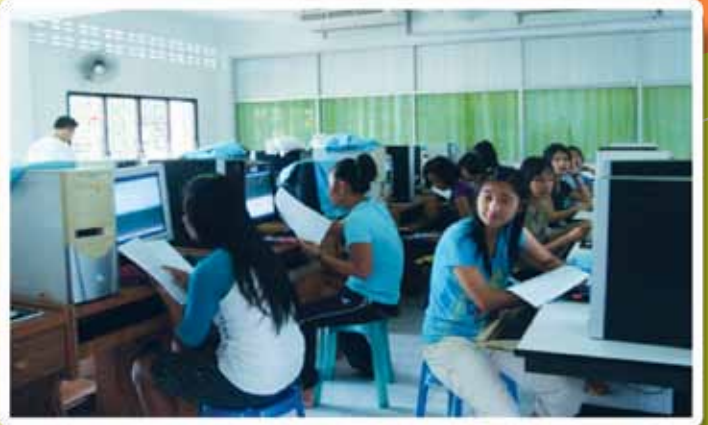
“โครงการฮักชุมชนอำเภอแม่แตง จัดอบรมการวิเคราะห์ข้อมูลเบื้องต้นให้กับเยาวชนของตำบลสันป่ายาง ณ โรงเรียนสันป่ายางวิทยาคม เมื่อวันที่ 8 ตุลาคม 2554”