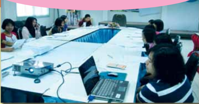
“โครงการฮักชุมชนอำเภอแม่แตง จัดอบรมการสร้างแบบสอบถามให้กับเยาวชน ตำบลสันป่ายาง ณ เทศบาลตำบลสันป่ายาง เมื่อวันที่ 24 กันยายน 2554”