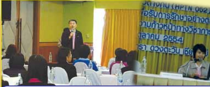
สถาบันวิจัยวิทยาศาสตร์สุขภาพ จัด “การประชุมเพื่อรับฟังผลการวิจัยของโครงการยาต้านไวรัสในผู้ผลเลือดเอชไอวีต่างกัน (HPTN 052) และการส่งต่ออาสาสมัครเพื่อรับการรักษายาอย่างต่อเนื่อง ร่วมกับการบรรยายพิเศษเรื่องความก้าวหน้าทางวิชาการด้านโรคเอดส์” และแนะนำหน่วยงานใหม่ของสถาบันฯ คือ หน่วยค้นหา-ส่งต่ออาสาสมัครโครงการวิจัยและบริการวิชาการแก่ชุมชน (Recruitment-Referral and Education Center: R-RE) เรียกสั้นๆ ว่า หน่วยอาร์ เมื่อวันที่ 7 ตุลาคม 2554 ที่ผ่านมาน ณ โรงแรมเซ็นทารา ดวงตะวัน อ.เมือง จ.เชียงใหม่