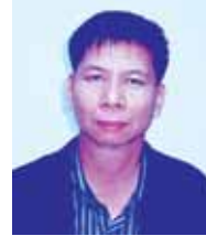
คุณสมบัติ กีฬาแปง ผู้อำนวยการ รพ.สต.บ้านป่าแป๋