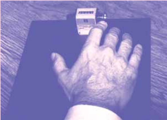
การตรวจ finger tapping เพื่อวัดความไวของการเคลื่อนไหวของนิ้วชี้แต่ละข้าง