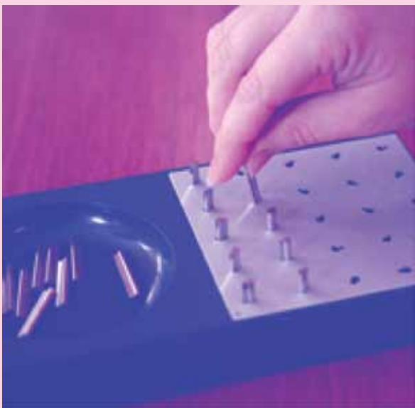
การตรวจ Grooved pegboard เพื่อประเมินความคล่องแคล่วและประสานกันของมือแต่ละข้างในการเอาหมุดใส่หรือออกจากรู