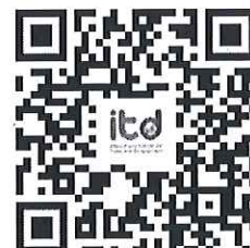
QR Code Facebook Live